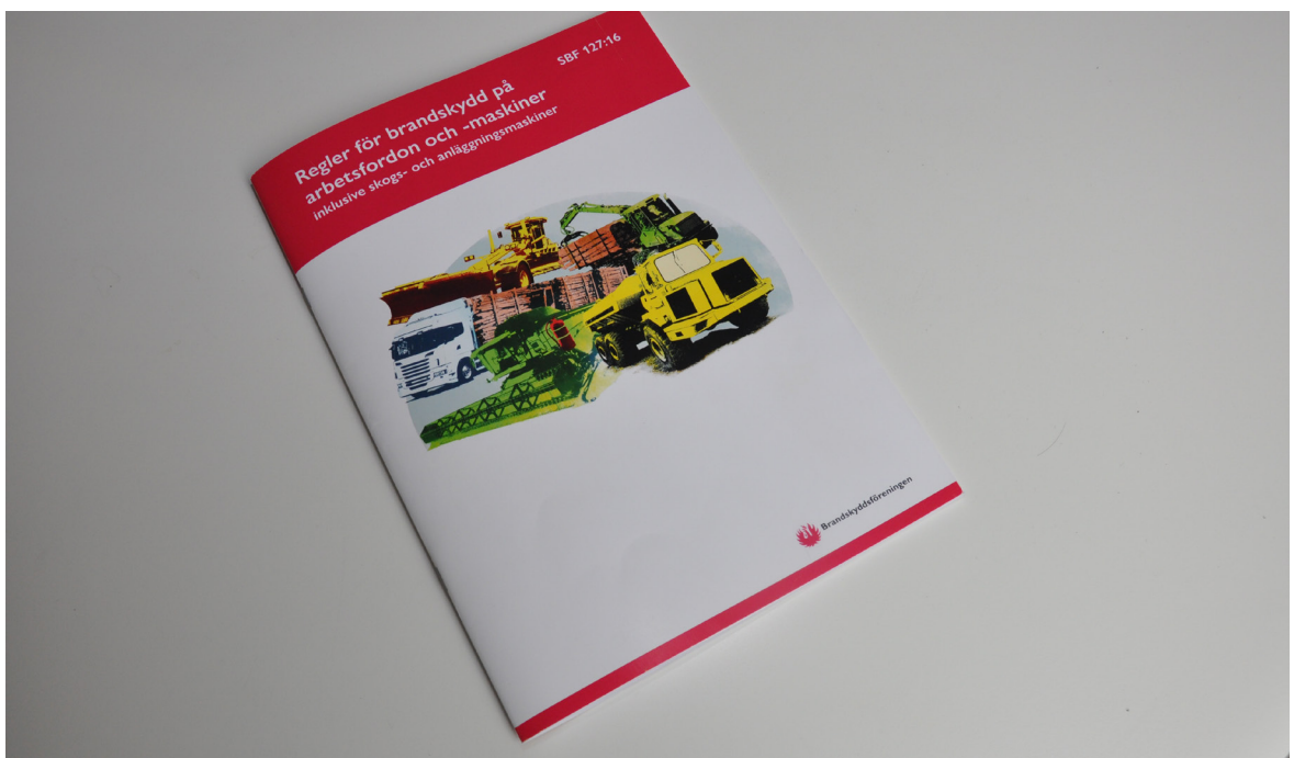
SBF 127:16.

Regelverket ställer krav på skicket på maskinens elektriska utrustning, att det skall finnas brandsläckare och på en årlig brandskyddskontroll. Dessa krav omfattar borrhiggar med förbränningsmotorer och de flesta typer av entreprenadmaskiner.